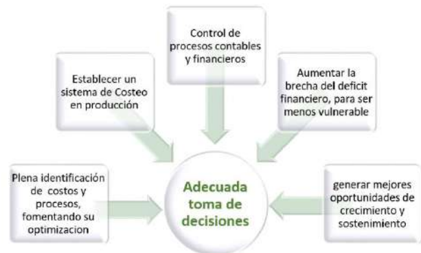
Figura 1.1 Características de los procesos en la medición del costeo

Importancia de estructurar un sistema de costeo efectivo para micronegocios, nuevos proyectos, microempresas, que a su vez, cuenten con herramientas financieras que faciliten su control primario