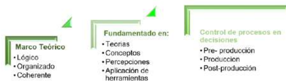
Figura 1. 2 Método del sistema de costos por identificación

coherente; fundamentado en teorías, conceptos, percepciones que sirvan como referencia a una serie de hechos económicos del costeo en los microestablecimientos de comercio y microempresas colombianas del sector primario. De tal manera que al implementar el nuevo sistema de costeo por identificación (SCI) se controlen los procesos con técnicas para establecer relaciones y comparaciones entre un proceso y otro. De igual manera permita el control y la regulación mediante toma de decisiones bajo etapas de preproducción, producción y posproducción. Dicho gráficamente, el método del SCI radica en: