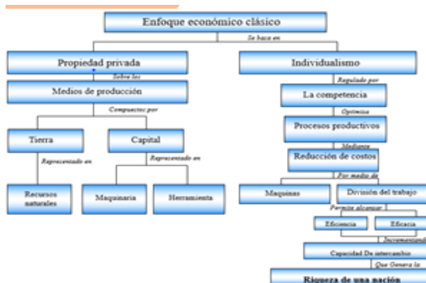
Figura 1: Enfoque clásico: fundamentos para la administración de una economía capitalista. Resumen a partir de la propuesta de Adam Smith en su libro riqueza de las naciones

en últimas, según Smith, genera la riqueza de una nación. Entonces el desenfreno privado se convierte en justicia pública mediante las fuerzas competitivas, que se inicia desde el egoísmo, que parece un malestar, pero que en ultimas es prosperidad para la sociedad. En sí, el crecimiento económico es una dinámica que parte del individualismo actuando en un marco de propiedad privada y mínima intervención del estado, que a la vez conlleva a la competencia, cumpliendo esta, con limitar los intereses individuales y a la optimización de los procesos productivos.