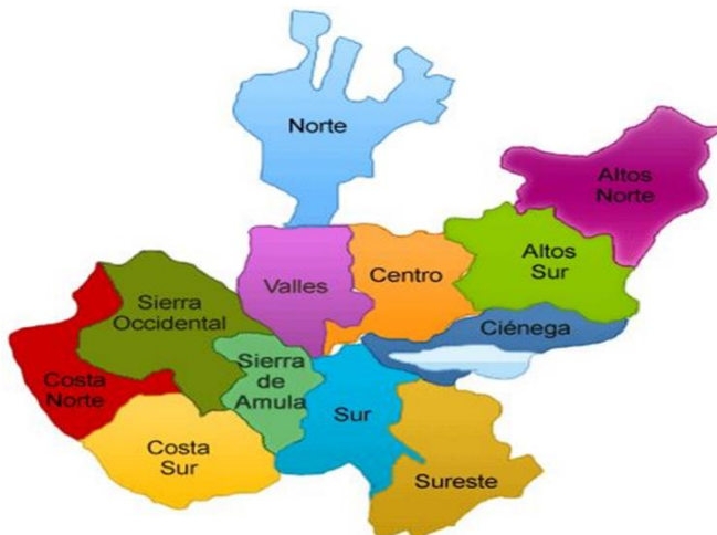
Imagen 1. Regionalización en el Estado de Jalisco

Estas regiones están ubicadas de esta forma en la geografía del Estado de Jalisco (ver figura 1), lo que ha determinado una mayor facilidad para un más adecuado manejo administrativo a partir de la identificación de las condiciones para la producción de ciertos productos en base a las condiciones ambientales e infraestructura presente: